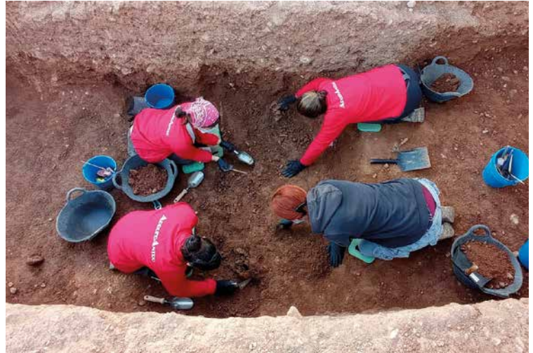
Exhumacions de les posicions 7, 8, i 9 de la fila 5. (27/10/2020) Foto: GRMHC. L'estudi d'aquesta quarta campanya se centrarà inicialment en les 9 víctimes que, segons la documentació, corresponen a set veïns d'Alcalà, un d'Almassora i un de Vinaròs.

represaliats, tot i que el procés pot fer que s'acaben identificant fins a 18 víctimes.