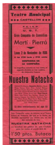
Programa de la representació de Nuestra Natacha

Una companyia italiana amb Teatro dei Piccoli , diverses actuacions líriques, Pastora Imperio, ball espanyol i espectacles de varietés completaren l'oferta d'uns cinquanta espectacles.