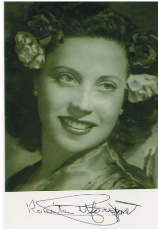
Retrat de l'actriu i cantant professional Rosita Montfort