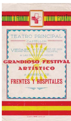
Programa d'una de les primeres representacions sota el règim franquista (Col·lecció Rosita Montfort)

Programa amb bandera després de l'arribada de les tropes franquistes.