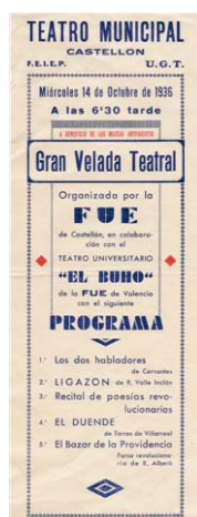
Programa d'El Búho

La programació continuà amb la visita de la companyia del Teatro Eslava de València durant tres dies, després de la qual actuà una companyia de sarsuela.