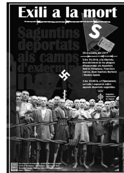
Cartell dels actes que es celebraren a Sagunt el 20 d'octubre del 2017.

Aquest estudi és fruit d'una col·laboració que vam començar els tres autors, amb uns projectes de memòria semblants, desenvolupats per als deportats d'Almenara i la Vall d'Uixó. Cap al maig de 2016 presentàrem a l'Ajuntament de Sagunt el primer esborrany amb les característiques del projecte. Encara que ja havien passat més de 75 anys se'ns presentava una oportunitat per a fer un reconeixement a uns saguntins, que van passar i morir dins les estructures d'internament al camp de concentració nazi de Mauthausen. Era (i és) necessari recordar aquests successos que ens van ensenyar el perquè no hem de tornar a repetir-los. Així ho comentàrem a l'esborrany, que va ser molt ben acollit, explicant que començaríem amb una part d'investigació, que és la que ens pareixia la més delicada. Primerament començà una recerca dins dels arxius espanyols 3 , inclosos els del mateix municipi, a la fi de recollir tota la informació disponible de les persones a tractar. Aquestes primeres recerques ens van aclarir un poc la faena, ja que vam traure que dels sis saguntins que en principi apareixen a les llistes, dos eren del Grau, però del de València; és a dir adscrits al Cabanyal. Van quedar per a l'estudi els saguntins: Juan Bautista Barberà Solà, Ramón Agustí Hervás, Francisco García Aucejo i Adrés Villaplana Rius.