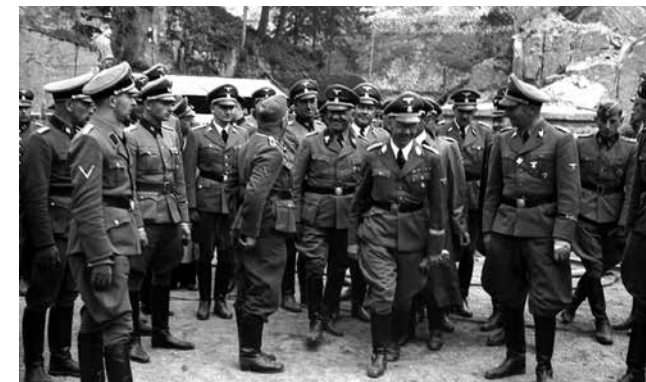
El Reich Führer SS Himmler, rodejat d'oficials en la pedrera de Mauthausen, dins d'una visita d'inspecció a la zona.