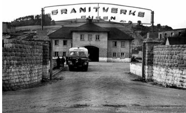
Entrada a la Granitwerke de Gusen, lloc on van morir la majoria dels presoners republicans espanyols.