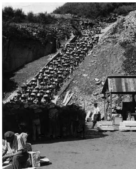
Fotografia de l'escala de la mort, amb els presoners, molts d'ells espanyols, pujant per a fer viatge i portant a l'esquena les pedres de granit que havien tret de la pedrera.

els altres se n'anaren i ells es van quedar allí, no hi havia lloc on anar. Però els nostres protagonistes saguntins ja no eren allí per a festejar-ho; havien mort juntament a milers de companys i amb els vius passaren a ser els olvidats. Així va ser i encara conti-nua 14 . Els deportats republicans espanyols van ser víctimes d'aquell horror i després de l'esperit de la Transició, on es fomentà l'amnèsia, la impunitat i l'oblit. Per això és important la memòria.