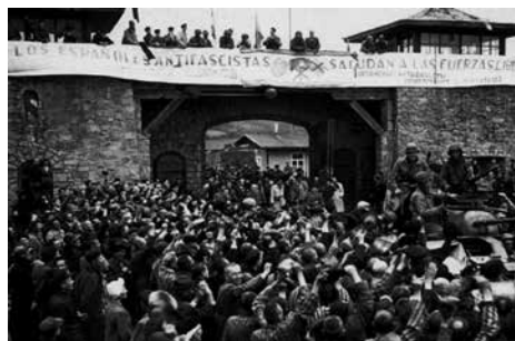
Presoners a les portes del camp de Mauthausen rebent a les tropes americanes. Penjada dalt i estesa per tot el mur es pot veure la famosa pancarta que els republicans espanyols hi van posar.

els altres se n'anaren i ells es van quedar allí, no hi havia lloc on anar. Però els nostres protagonistes saguntins ja no eren allí per a festejar-ho; havien mort juntament a milers de companys i amb els vius passaren a ser els olvidats. Així va ser i encara conti-nua 14 . Els deportats republicans espanyols van ser víctimes d'aquell horror i després de l'esperit de la Transició, on es fomentà l'amnèsia, la impunitat i l'oblit. Per això és important la memòria.