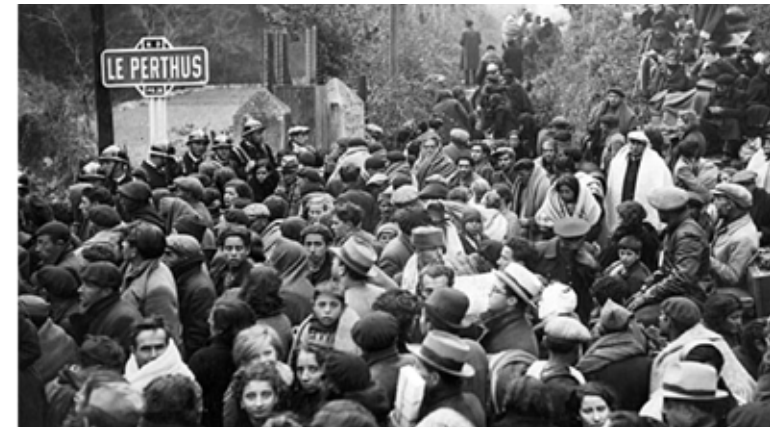
Refugiats republicans intentant passar la frontera francesa a Le Perthus.