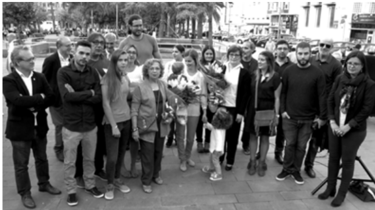
Representants de l'Ajuntament junt a familiars dels deportats la vesprada dels parlaments, en el lloc de les plaques a la plaça Cronista Chabret.