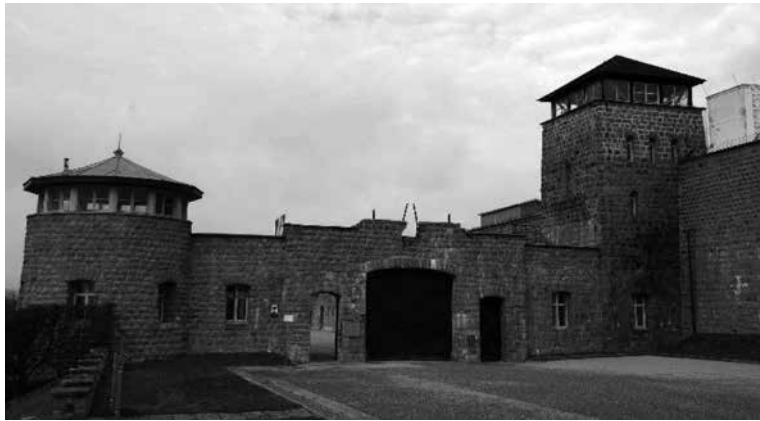
Porta d'entrada al camp de Mauthausen en l'actualitat.

proclamació de l'actual Constitució (i amb molta mesura) es va tocar el tema de passada; ahí queda això. Després i poc a poc, arribà la moda no perduda encara del negacionisme històric, vinculat al recolzament dretrà dels governs d'Aznar, en els que es va retroalimentar la qüestió de la necessitat del cop d'estat front a la dubtosa legitimitat republicana. Històricament, la nostra necessària i benvinguda llei de Memòria històrica quedarà com a incompleta, feble i sobretot feta a destemps on no es posa el punt damunt la tercera vocal, és a dir: la creació d'una constitució que hagués derogat els actes i lleis que sorgiren del govern franquista, reinstaurant la legalitat republicana.