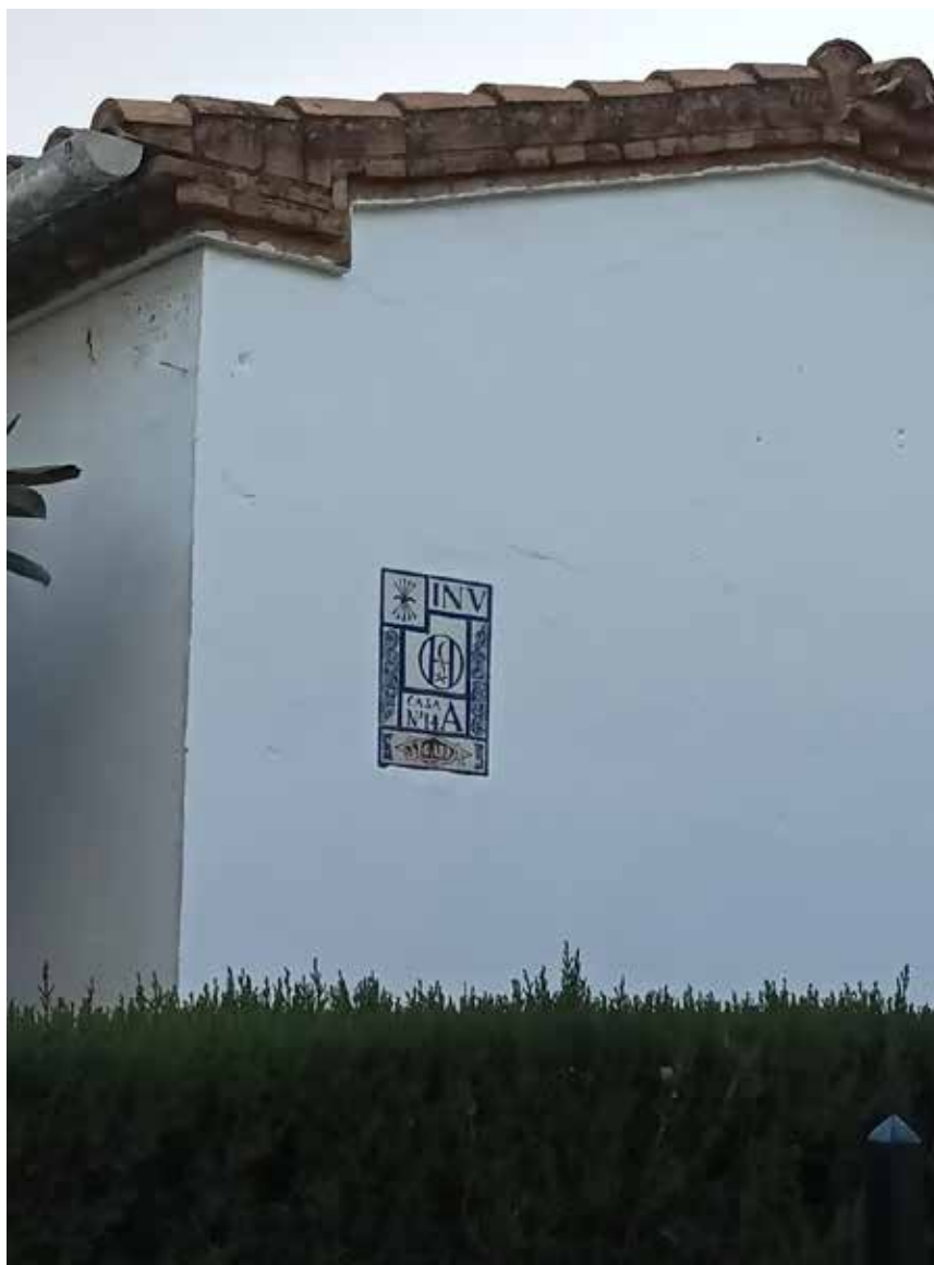
Fotografia Monument als caiguts.