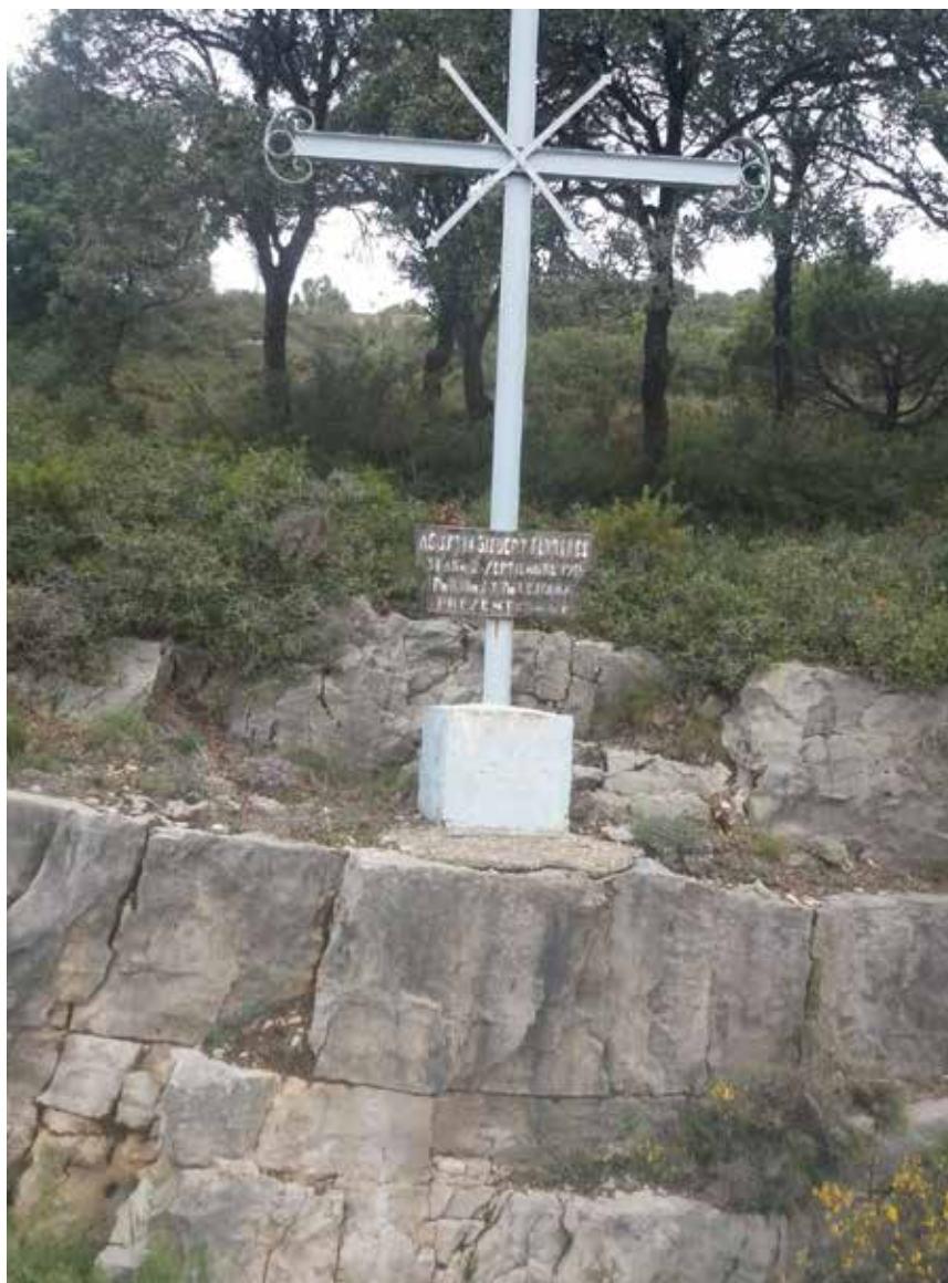
Fotografia Creu de ferro.