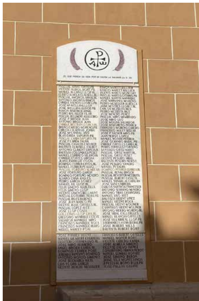
Fotografia Façana de l'església.