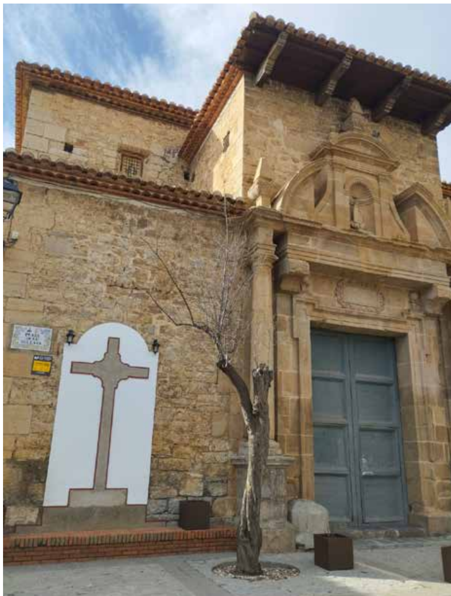
Fotografia Façana de l'esglèsia.