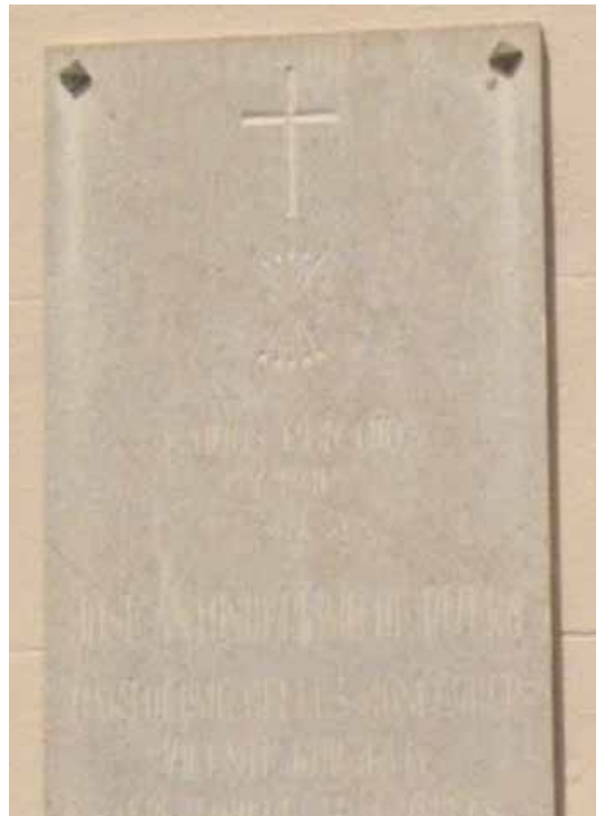
Fotografia Façana de l'església.