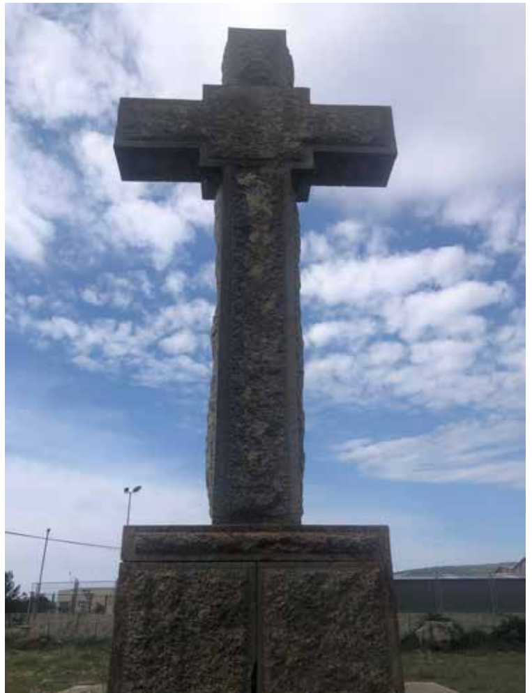
Fotografia Partida la Dehesa.