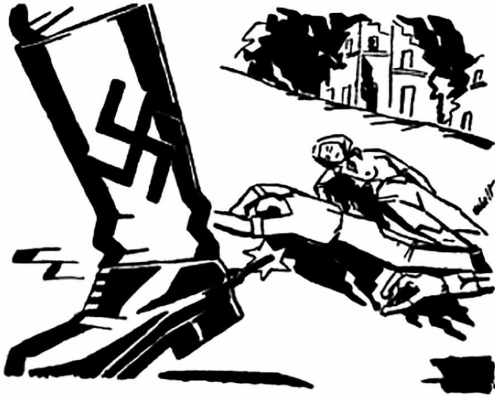
| Ilustración de Tomás Vera Morales (Esbelt)

E STE ES EL FASCISMO HISPANO PURO, DEL 36, QUE DESARROLLÓ TODA UNA GAMA DE ATROCIDADES, ATROPELLOS Y ABERRACIONES HABIDAS Y POR HABER. DESDE FUSILAMIENTOS EN MASA, DESAPARICIONES, JUSTICIA MILITAR A MEDIDA DEL PODER