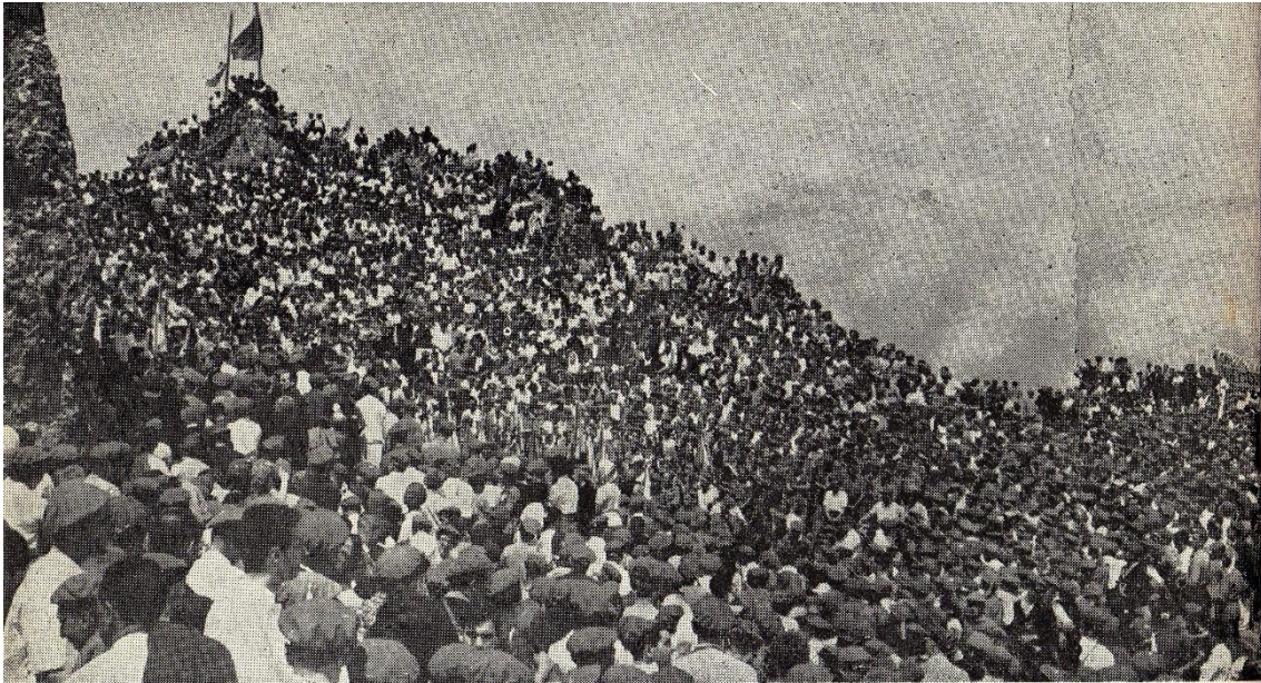
Imatge del multitudinari acte de Montejurra dels anys seixanta.

El règim no podia tolerar que una organització popular i de masses com era el carlisme —que havia fet la guerra al bàndol nacional—, s'oposés de manera ostentosa al sistema filofeixista de FET i de les JONS, ni al posterior sistema filoliberal dels tecnòcrates de l'OPUS.