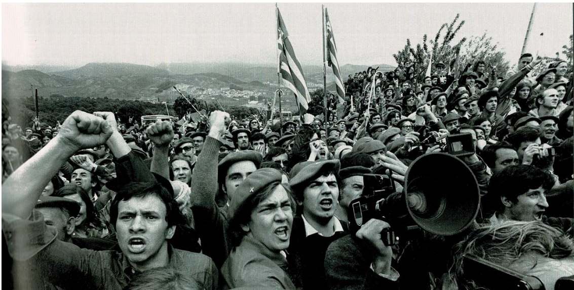
Un aspecte de la protesta de joves carlistes després de les agressions del Montejurra-76

Per això, des de les clavegueres de l'Estat, amb implicació del rei Joan Carles, Suárez, Fraga, etc., es va orquestrar la dita «Operación Reconquista», per intentar convertir Montejurra en un acte domesticat. I per això es va comptar, protegits per la Guàrdia Civil i la Policia Armada, amb els pistolers mercenaris neofeixistes —les habitacions dels quals en un hotel proper a Ayegui, van ser reservades pel Govern Civil—. Però alhora, perquè no semblés una agressió, es va intentar implicar organitzacions ultres espanyoles com la UNE o tradicionalistes nostàlgics —passats al franquisme joancarlista— que, suposadament, haurien d'acudir en massa a suplantar el carlisme esquerrà, per a la qual cosa, des del Govern es facilitava el material, la logística, els autobusos i les dietes, per valor de 5.687.500 pessetes. Tanmateix i segons un informe confidencial de la Guàrdia Civil, no van poder mobilitzar més que 600 persones davant dels 6.000 carlistes que van poder acudir, segons el mateix informe.