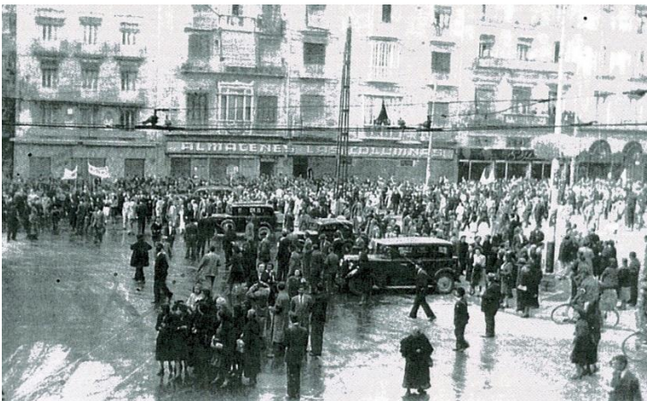
Manifestació carlista a València per celebrar l'alliberament d'en Xavier de Borbó Parma del camp nazi de Dachau el 1945. Hi va haver una trentena de detinguts, empresonaments i multes.

L'oposició carlista a la dictadura venia de lluny. En Xavier va ser expulsat per Franco en plena guerra per oposar-se a la política feixista; després va fer la resistència a França, va ser detingut per la Gestapo, internat al camp de concentració nazi de Dachau i, quan el van alliberar, per celebrar-ho, hi va haver manifestacions al seu favor arreu de les Espanyes; la realitzada al Cap i Casal, de milers de carlistes valencians, va suposar un enfrontament amb la Policia on hi va haver ferits, empresonaments i multes a una trentena de carlistes. Encara que l'oposició de l'època era des de posicions tradicionalistes, a partir dels anys seixanta, i a causa d'una evolució política i ideològica, el Partit Carlista es va situar a l'esquerra defensant una alternativa socialista autogestionària, formant part de tots els organismes unitaris d'oposició democràtica que intentaven acabar amb la dictadura i impedir la instauració de la monarquia de Franco.