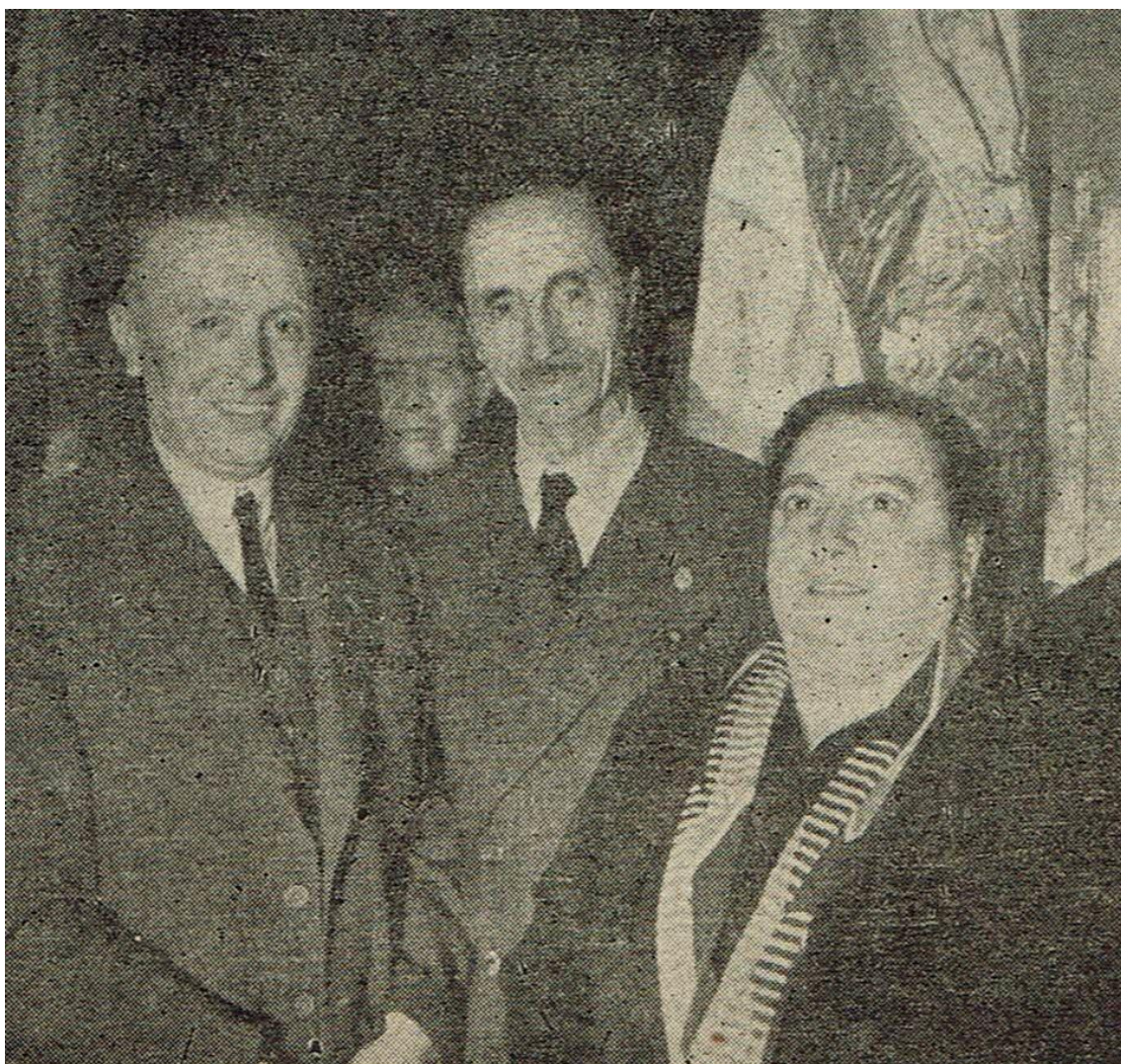
En Xavier de Borbó Parma amb els pares de Joan Fuster a Sueca els anys cinquanta.

I és que el carlisme majoritari, seguidor d'en Xavier de Borbó Parma i del seu fill Carles Hug, no només representava una alternativa a la monarquia franquista, sinó que, des que el dictador va prendre el poder, va mantenir un pols amb el règim i una oposició al mateix, que li va costar la persecució entre 1936 i 1982 a base de censures, expulsions, detencions, tortures, empresonaments, consells de guerra i morts, segons es demostre en les meves investigacions, de les quals es van publicar dos llibres: La rebeldia carlista. Memoria de una represión silenciada...(1936-1955) (Schedas) i Una represión olvidada. El carlismo perseguido por el franquismo i la extrema derecha (1955-1982) (Txalaparta).