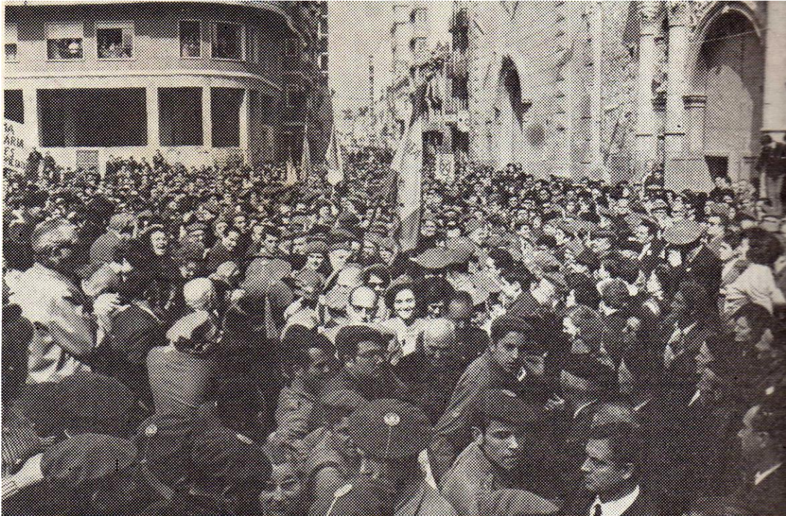
Un aspecte de l'aplec carlista d'Algemesí a mitjans dels anys seixanta.

L'oposició carlista a la dictadura venia de lluny. En Xavier va ser expulsat per Franco en plena guerra per oposar-se a la política feixista; després va fer la resistència a França, va ser detingut per la Gestapo, internat al camp de concentració nazi de Dachau i, quan el van alliberar, per celebrar-ho, hi va haver manifestacions al seu favor arreu de les Espanyes; la realitzada al Cap i Casal, de milers de carlistes valencians, va suposar un enfrontament amb la Policia on hi va haver ferits, empresonaments i multes a una trentena de carlistes. Encara que l'oposició de l'època era des de posicions tradicionalistes, a partir dels anys seixanta, i a causa d'una evolució política i ideològica, el Partit Carlista es va situar a l'esquerra defensant una alternativa socialista autogestionària, formant part de tots els organismes unitaris d'oposició democràtica que intentaven acabar amb la dictadura i impedir la instauració de la monarquia de Franco.