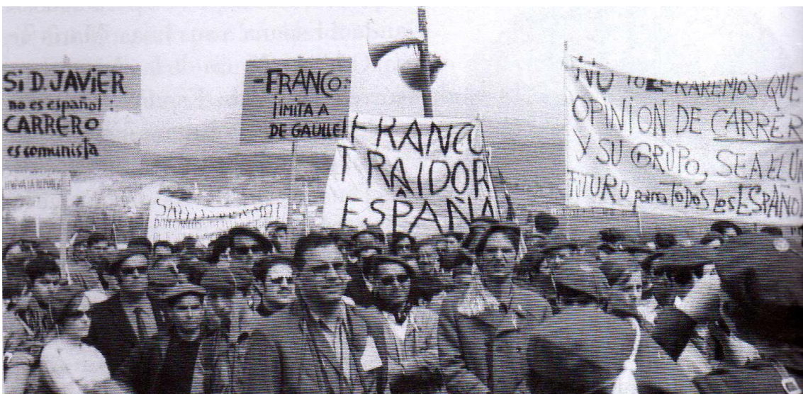
Pancartes de en l'acte de Montejurra de 1969