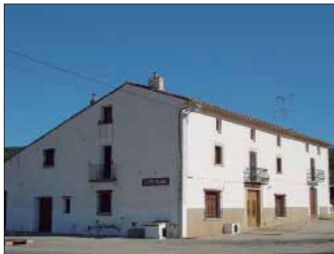
Figura 2. En la almazara de esta masía del Maestrazgo castellonense se instaló, durante la primavera de 1938, un hospital de primera línea.

A los 20 días de estar allí, recibió la orden de evacuación porque el enemigo había avanzado y se encontraba muy cerca. Fue entonces cuando el capitán P.I.M. decidió instalar el hospital en una caseta de peones camineros situada en la carretera entre Vilafamés y Sant