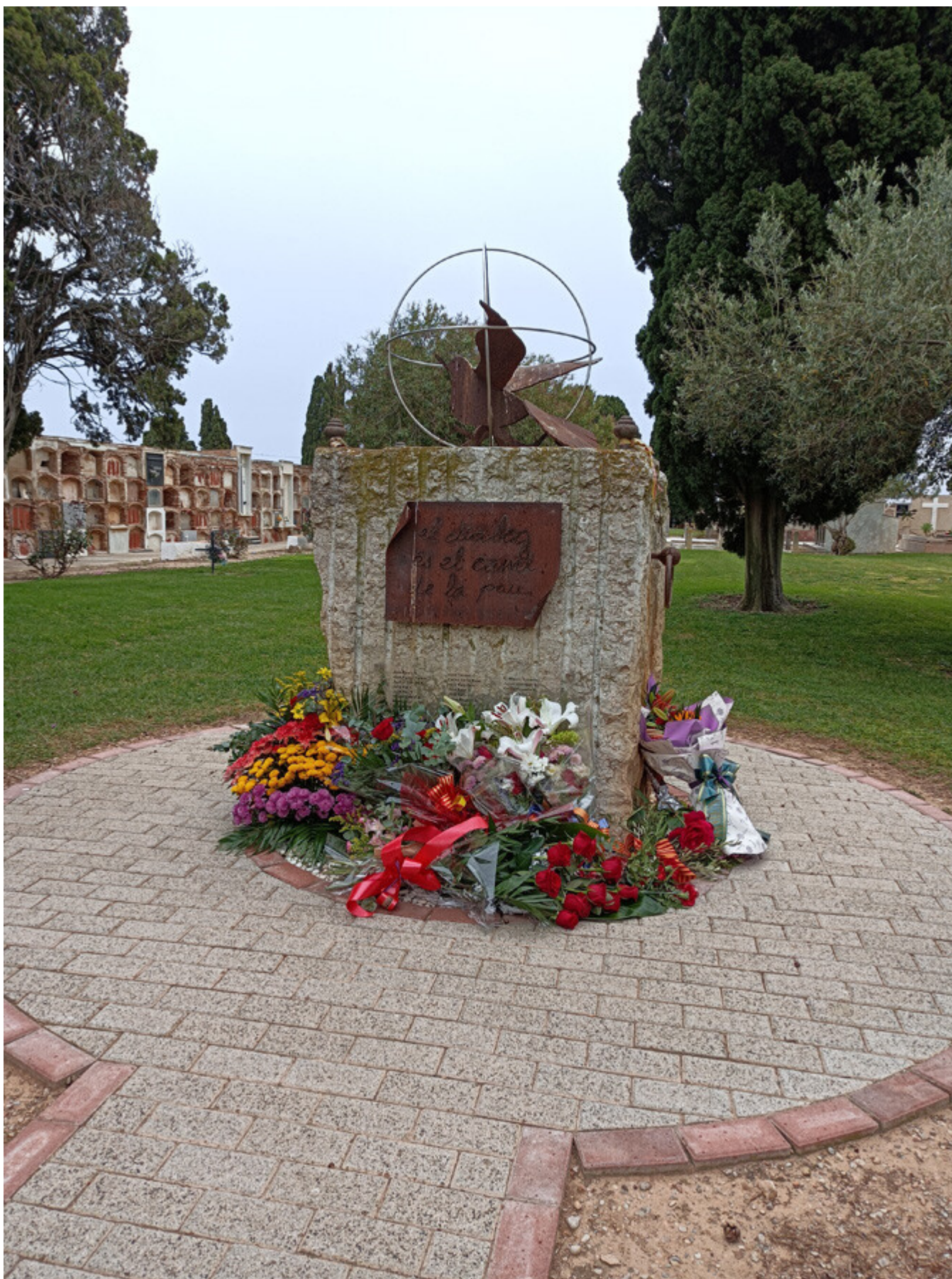
Imatge del memorial en homenatge a les víctimes de la dictadura de la fossa comuna de Vinaròs amb els rams de flors i reconeixements el dia 12 d'abril de 2026

En els temps que corren, en què «negras tormentas agitan los aires», són fonamentals saber, la raó i el coneixement i reconeixement del passat més tràgic que ha conegut la història del nostre país. Saber per reflexionar i reflexionar per saber, per saber millor