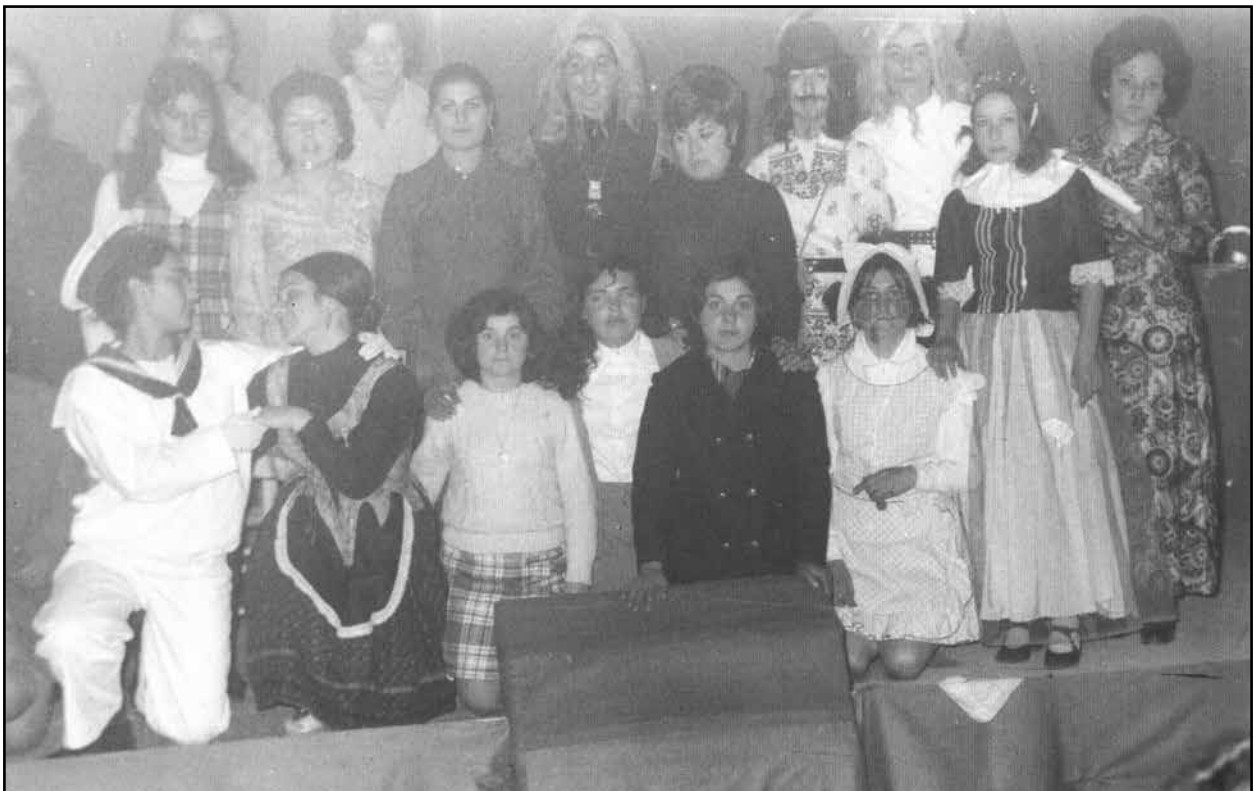
Activitats de teatre de les joves que feien el Servei Social a començament dels anys 70.